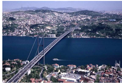
Bosporus Brücke - Istanbul