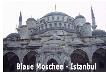
Blaue Moschee - Istanbul