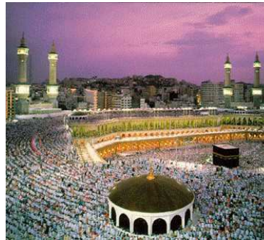
Kabe - Mekka